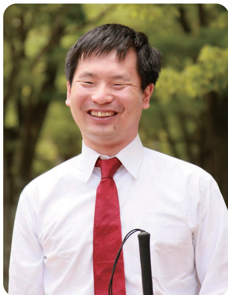
水泳（ しかくしょうがい 視覚障害）