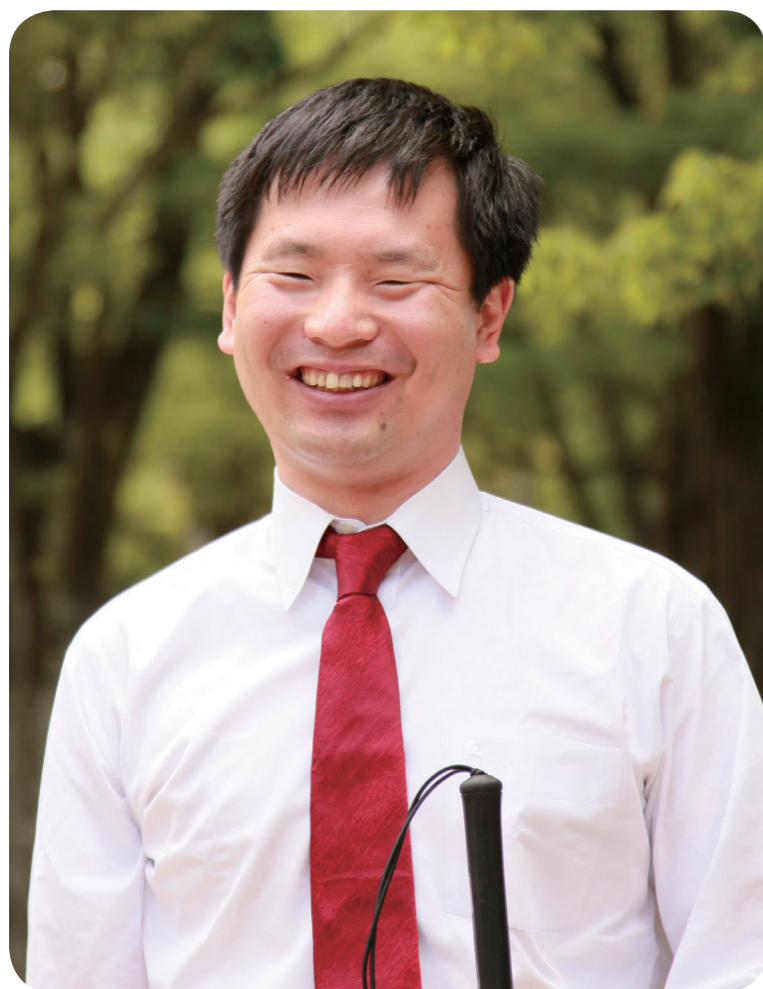
水泳 しかくしょうがい （視覚障害）