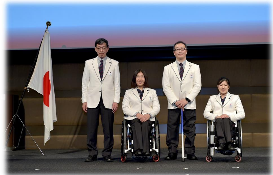
北京2022パラリンピック冬季競技大会 結団式