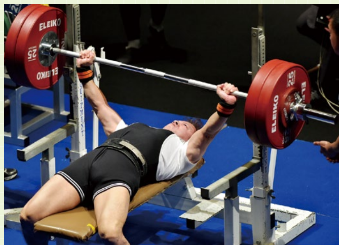
視覚障がい選手のベンチプレス種目

国際視覚障がい者スポーツ連盟（IBSA）が4年に一度開催するIBSAワールドゲームズへ、視覚障がいの選手を日本代表選手として派遣しています。また、日本パラ・パワーリフティング連盟主催の大会では、視覚障がい者部門を設けている大会もあります。